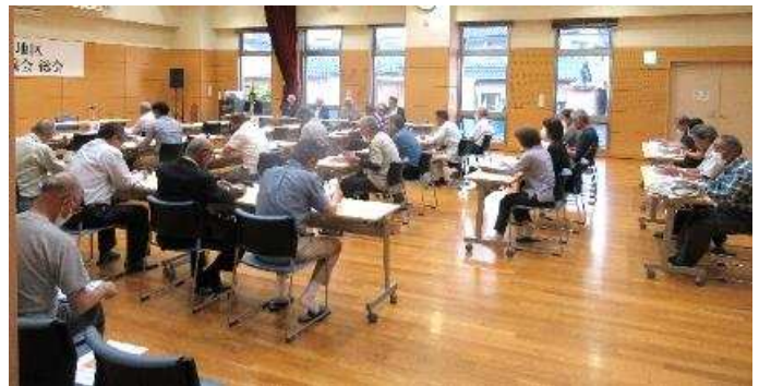
令和6年度 玖珠地区コミュニティ運営協議会 役員