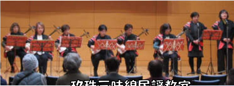
玖珠三味線民謡教室