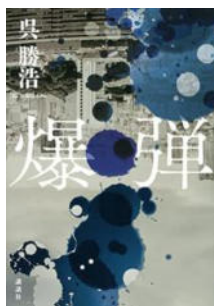
爆弾 呉 勝浩