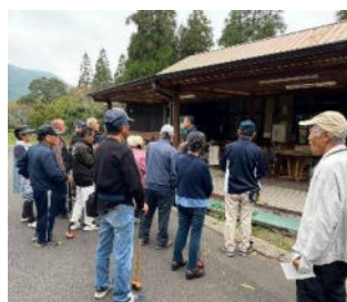
19名の参加がありました