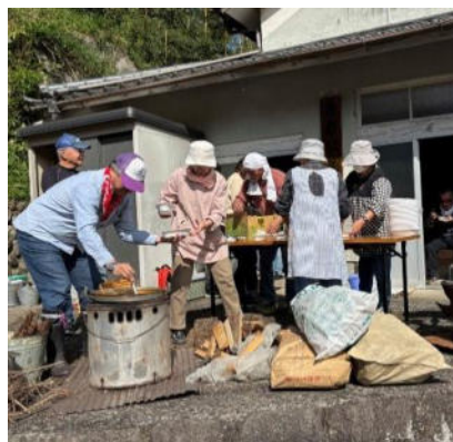
炊き出し訓練の様子(唐杉)

10月26日(日)、唐杉地区は『豪雨による唐杉川上流域からの洪水』という、地域の特性を踏まえた災害を想定し、27名