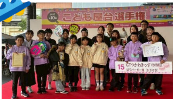
ICT つかわきっずのみんな、最優秀賞おめでとう!!