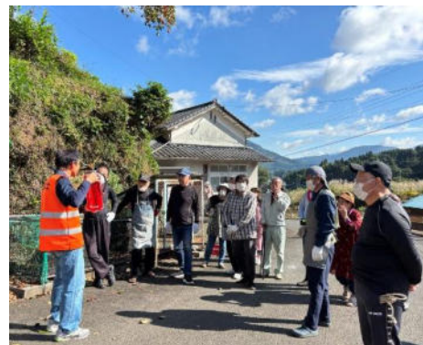
水防訓練の説明(唐杉)