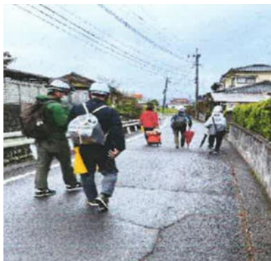
ヘルメットを着用し避難所へ(長野新町)