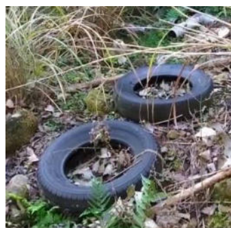
発見された不法投棄ゴミと回収作業の様子