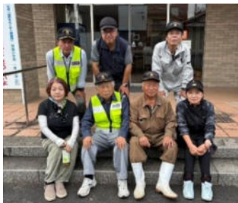
交通安全協会の皆さん、ありがとうございます!

12月6日(土)の11時頃、Aコープ玖珠店 近辺の210号線にて、玖珠郡女性ドライ バーによる信号色のお餅の配布があります。