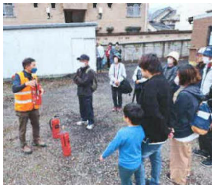
消火訓練の様子(長野新町)