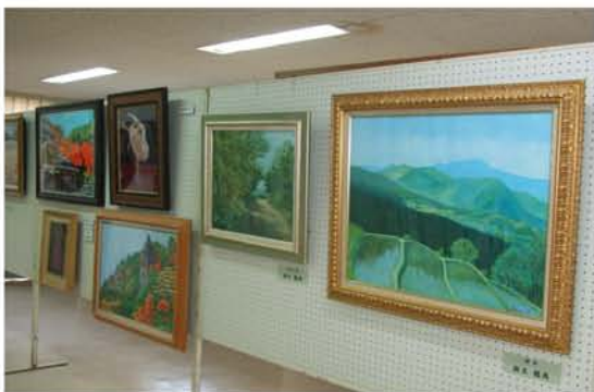
多数の絵画や写真などの作品がよせられました。