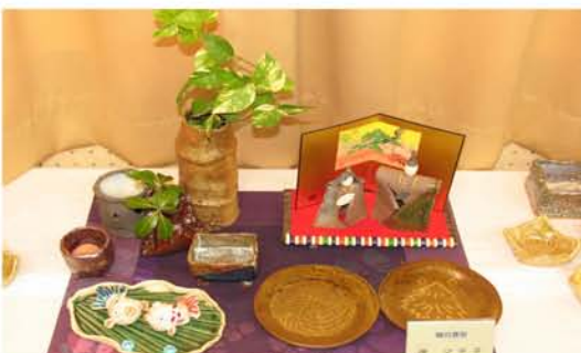
雛人形が飾られた陶芸教室のコーナー