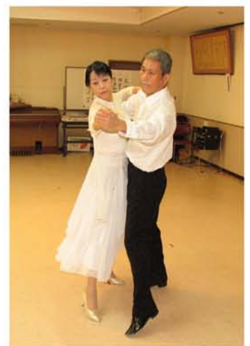
優雅なワルツで会場を魅了

○文化祭が身近に感じられ本当によかった。ぜひ毎年続けていただきたい。感動しました。