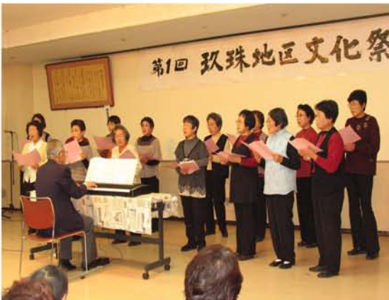
「コーランセム」と一緒に「おぼろ月夜」の合唱（左）と「皆さん一緒に」で盛り上がる会場のようす（右）