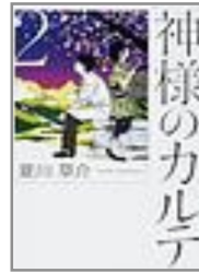
夏川 草介 著 「神様の カルテ2」