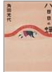
角田 光代 著 「八日目の蝉」