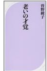
曾野 綾子 著 「老いの才覚」

今月の新刊紹介～ 地方病院を舞台にした いのちの物語「神様のカルテ2」と、誘 拐犯と誘拐された少女・・心をゆさぶる 長編サスペンス「八日目の蝉」、自立し た老人になり人生をおもしろく生きる力 を考える「老いの才覚」です。 図書の出借を希望の方は、事務室に声 をかけて下さい。