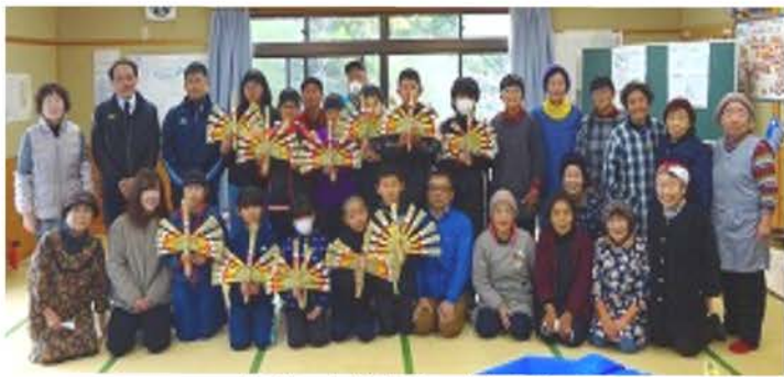
立派なしめ飾りができました