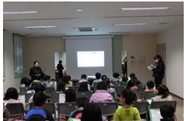
皆さん元気に質問をしていました

施設見学を通して児童の皆さんが自分たちの住んでいる町を詳しく知り、地域の方々とのふれあいも出来て楽しそうでした。