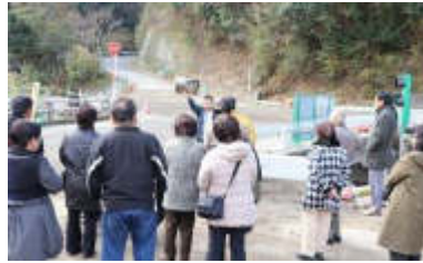
説明をうける役員一同

7月5日に発生した大水害で、壊滅的な打撃を受けてしまった東峰村の宝珠山地区は、山は崩れ、田んぼは埋まり、家は押し流されてしまい、7月5日～6日のたった2日間でもチャクチャクになってしまったそうです。