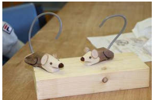
かわいいネズミができました