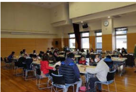
親子で熱心に取り組んでいました