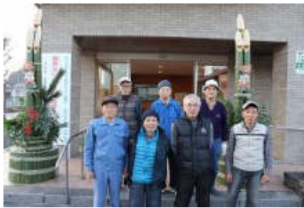
竹の採集から門松の作成までお疲れ様でした!