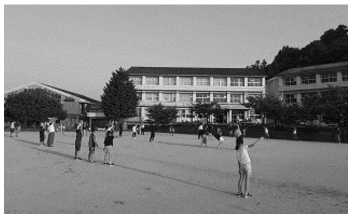
清々しい一日の始まり

8月11日(火)から21日(金)まで、塚脇小学校グラウンドで早朝よりラジオ体操が行われました。 新型コロナウイルスの影響で今年は短い夏休みになりましたが、子供たちを中心に地域の方々も積極的に集い、毎日約80名の参加者が元気いっぱい体を動かししました。 カードにスタンプをもらおう子供たちの嬉しそうな笑顔がとても印象的でした。