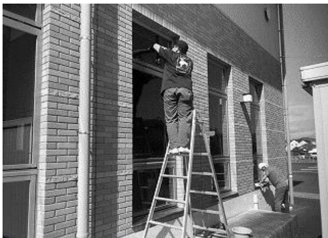
高いところも頑張りました

7月30日(木)に、玖珠自治会館の大掃除を行いました。普段行わない窓拭きや、外壁の掃除を中心に、自治会館全体を綺麗に掃除しました。 いつも使って頂いてる皆様 が気持ち良く活動できるように、自治会館職員一同、綺麗な会館の維持を目指して参りますので、今後とも宜しくお 願い致します。