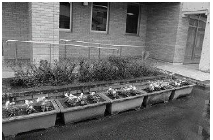
是非見に来てください

8月7日(金)に、玖珠自治会館の玄関と駐車場側の花壇の花植えを行い、日日草(ニチチソウ)の花を合計48本植えました。 日日草の花言葉は、「楽しい思い出・友情」です。日日草は、毎日のように新しい花を咲かせます。「次から次へと楽しい出来事があった頃の思い出」を大切に思う気持ちが由来となり、この花言葉が生まれたと言います。