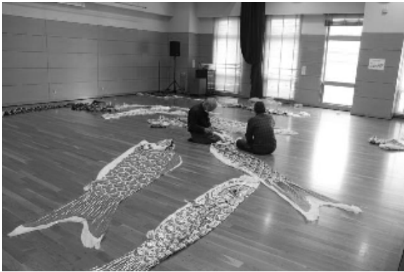
今年も元気に泳いでほしいです

山頂で元気に泳ぐこいのぼ りの姿は、くすふれ愛だより 6月号でお伝えします。ご期 待下さい!