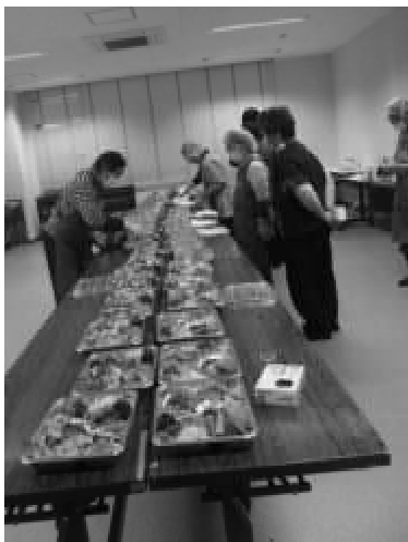
コロナ対策は抜かりなく

色んな楽しいことを計画しながら、新型コロナが通り過ぎるのを待ち、皆さんと共に、初心の 呑んな笑顔でつながろう。いつでも！どこでも！ だれとでも！ に向かつて、前向きに頑張りましょう！