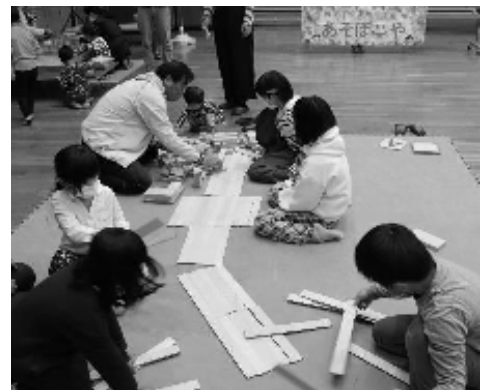
大人も子供も夢中です