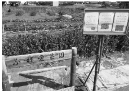
立派な看板がお出迎え