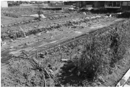
綺麗に手入れされた畑

もしご家庭で余剰になった種子・苗等があ りましたら、ご提供をお願いします。近くに お越しの際はぜひご覧下さい。