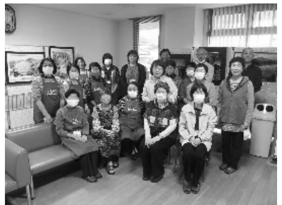
スタッフの皆さんお疲れ様でした