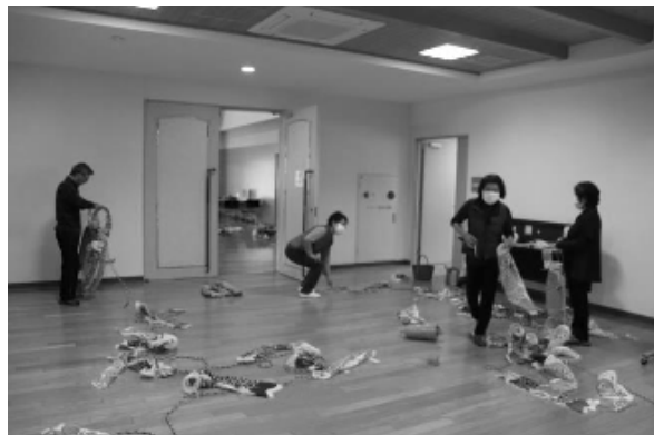
カラフルな小こいのぼり