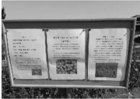
育てている作物を紹介