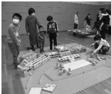
立派な塚脇小学校が完成！