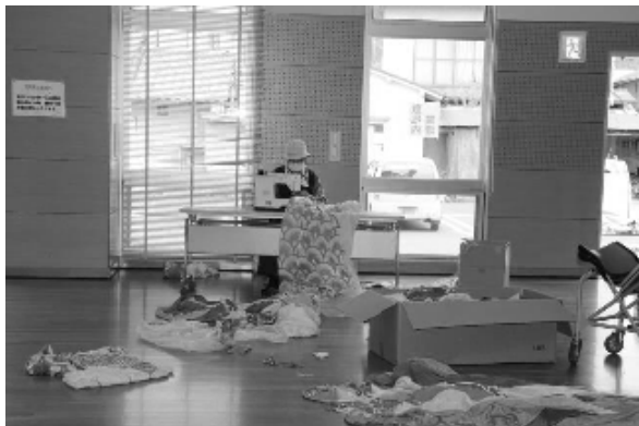
傷んだ箇所の補正作業