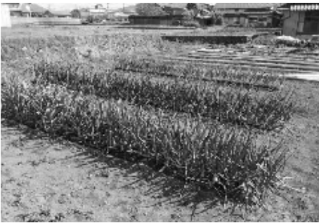
たくさん育ちますように