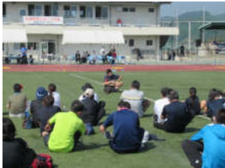
成迫氏のストレッチ指導