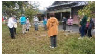
参加者21人・防災士1名