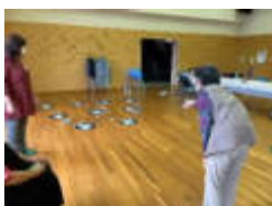
神経を集中させての一投

〈お問い合わせ先〉玖珠町地域包括支援センター ☎72-7154 新型コロナウイルス感染拡大状況によっては、中止する場合があります。