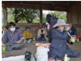
災害用ポテトサラダ試食