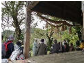
自治委員・防災士説明