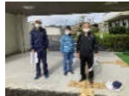
参加者3名・防災士1名