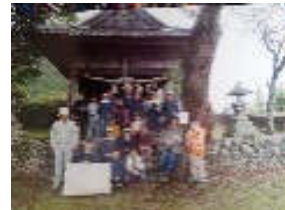
参加者22名・防災士2名