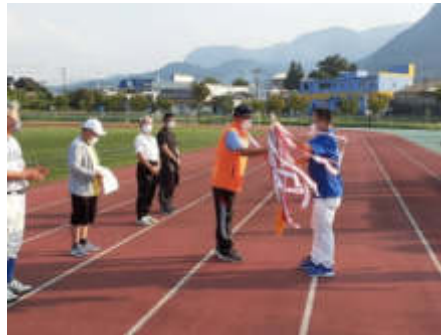
優勝旗を受け取る森館長