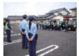
防犯機動隊の皆さん

10月15日(土)、機動隊員12名と玖珠警察署の合同で地区内の防犯啓発パレードを機動隊のパトロールカー3台と玖珠署の車で行いました。今回は玖珠署の要望で地区内の大型スーパー等すべての店舗に立ち寄り防犯啓発活動を行いました。地区内でも空き巣、車上荒らし等が報告されています。少しの間でも用心をお願いします。