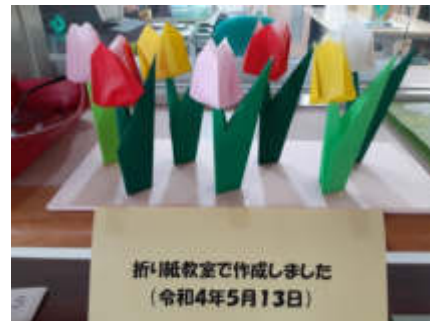
色とりどりのチューリップ