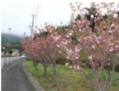
四季折々の花木を楽しめます