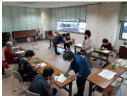
皆さん楽しく作業されていました

5月13日(金)、第1回目の折り紙教室が開催されました。『折り紙わらべ』の皆さんのご指導で、かわいいチューリップができました。参加した皆さんは「久しぶりに手先を一生懸命使った」と、教室を楽しんだ様子でした。作品は事務室窓口に飾っています。是非ご覧下さい。