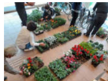
生き活きとした苗がたくさん並びました