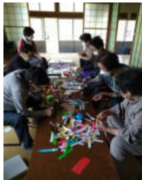
週一体操の皆さん(唐杉)